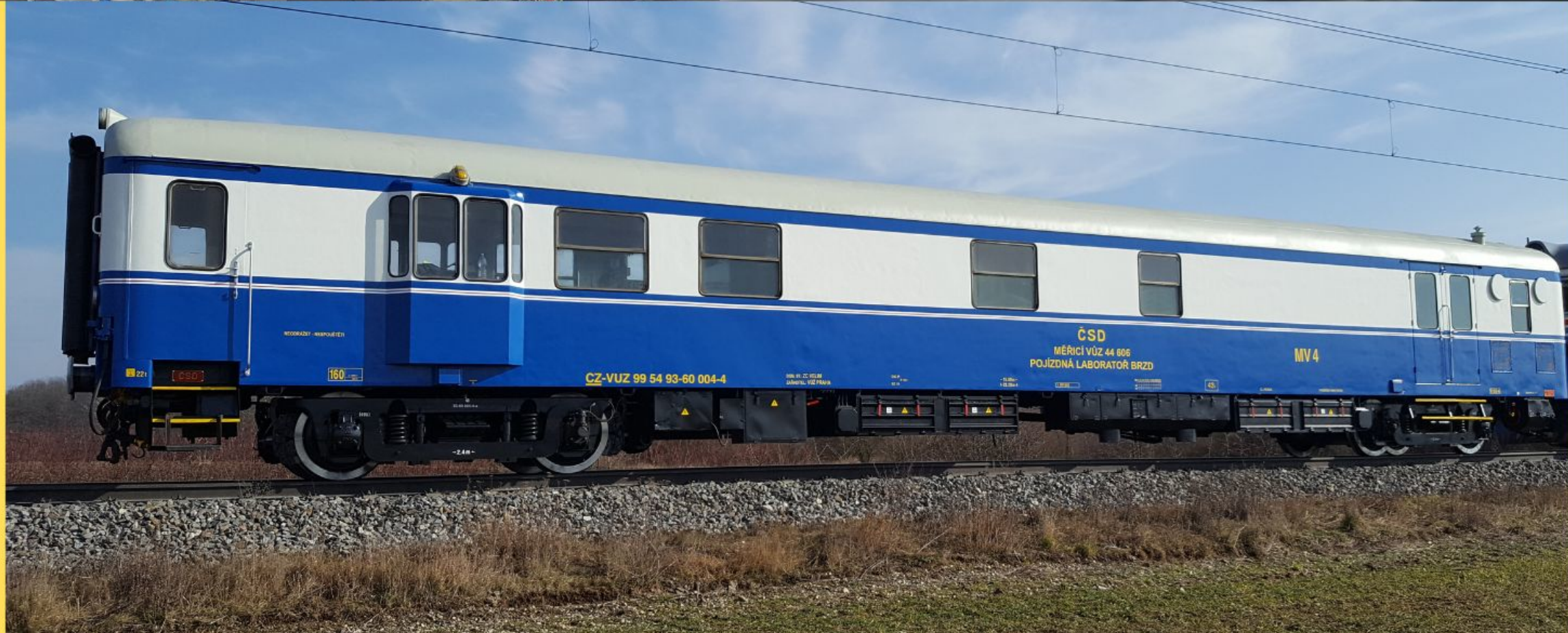
Poslední osobní vůz Tatra řady Da upravený v prostorách Ringhofferových závodů (ČKD Tatra Smíchov 1971)